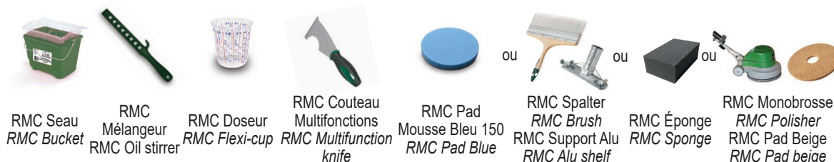
RMC Seau / RMC Bucket RMC Mélangeur / RMC Oil stirrer RMC Doseur / RMC Flexi-cup RMC Couteau Multifonctions / RMC Multifunction knife RMC Pad Mousse Bleu 150 / RMC Pad Blue RMC Spalter / RMC Brush RMC Éponge / RMC Sponge RMC Monobrosse / RMC Polisher / RMC Pad Beige / RMC Pad beige